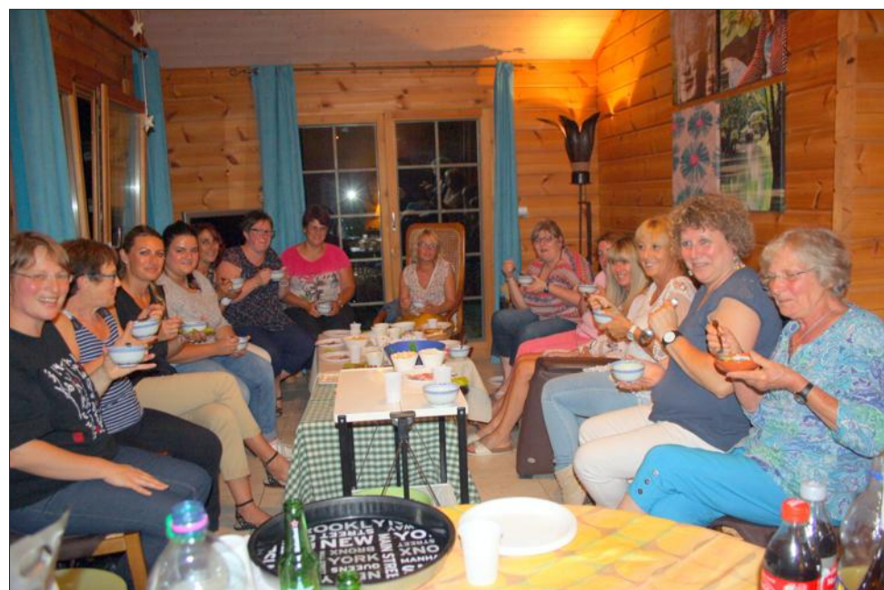
Les membres actifs de l'union commerciale ont testé les nouvelles soupes qui seront servies au cours de la soirée.