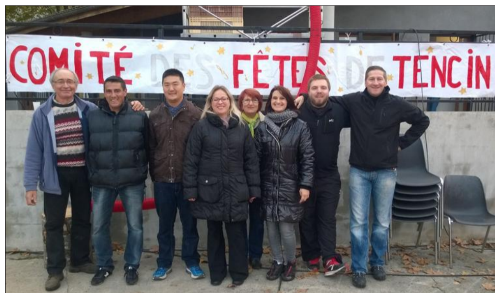
Une partie de l'équipe du très actif comité des fêtes.

Réservations obligatoires sur cdf.tencin@gmail.com