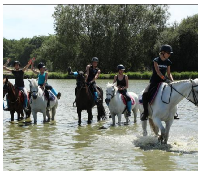
La cavalerie comprend des poneys expérimentés permettant aux plus petits, dès 6 ans, de débiter, et des chevaux pour les plus grands et les adultes.

Comme c'est le cas pour toutes les associations sportives, septembre est le mois de la rentrée. Celle-ci s'est très bien passée au Poney club écurie du Bréda (PCEB), et les inscriptions sont ouvertes. Soutenu par l'association Décliac à cheval, qui gère les animations en collaboration avec le club, les barres d'obstacles ont été repeintes, d'autres ont été rattachées.